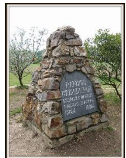
Monument installed in 1920 (i.e. 300 anniversary of the battle – by Sokol!)